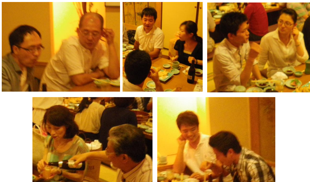
懇親会でのひとこま