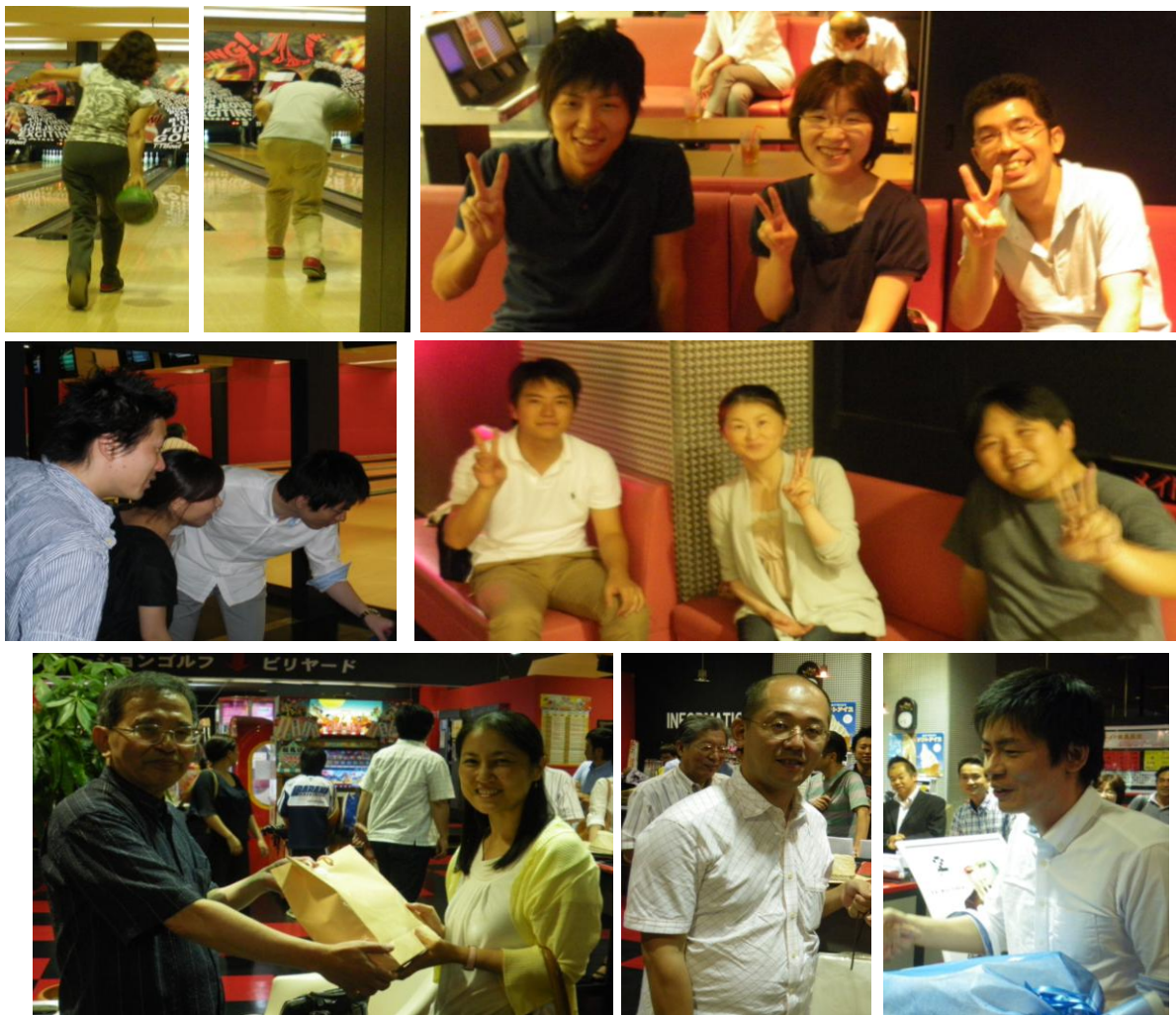
ボウリング大会でのひとこま