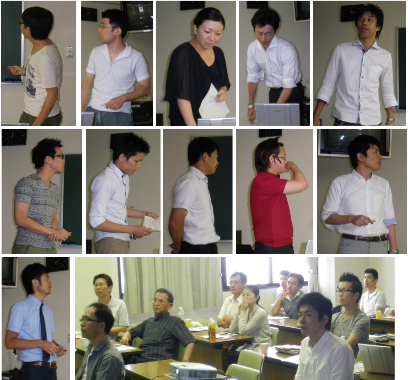
シンポジウムでのひとこま